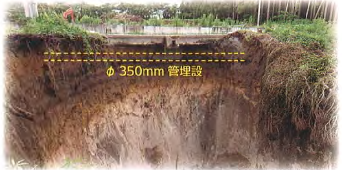
志布志市道（有明町伊崎田）宇尾支線水路φ350mm埋設

土砂崩れが進行すると、大規模漏水による二次災害のおそれがあったため大雨が予想される期間は、ダムからの取水を停止し、制水弁を閉めました。