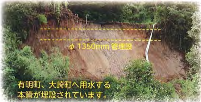
鹿屋市道（輝北町平房）野方導水路φ1350mm埋設