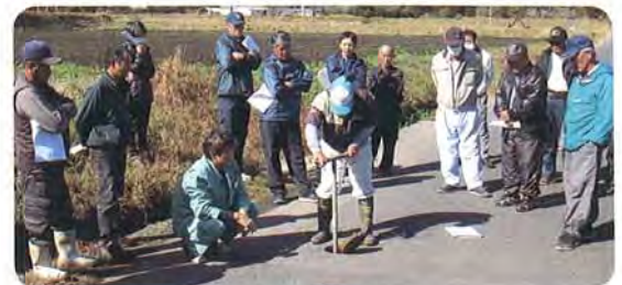
(2月におこなった班長研修の様子)

平成30年1月より2年間の任期で班長さんが交代になりました。各分水工の班長さんは下記のとおりです。