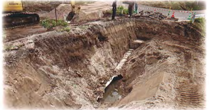
破断した用水管（地下約3mに埋設）