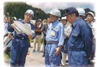
山本順三防災担当大臣と森山裕衆議院議員