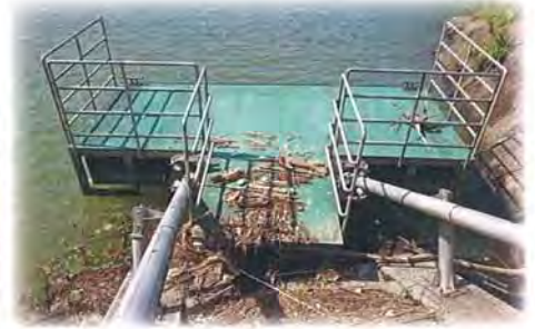
ポート係留設備破損