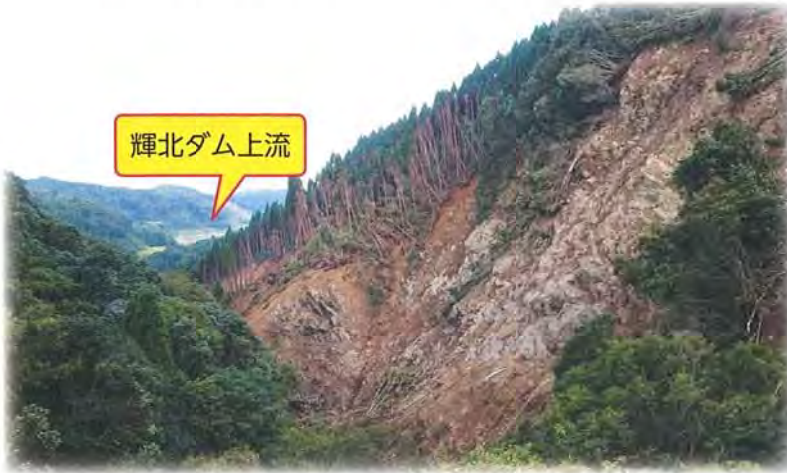
ダム上流部で発生した山の崩壊

昨年 9 月 20 日未明に通過した台風 16 号により、輝北ダムでは大きな被害を受けました。平成 17 年のダム完成以来、過去最大となる雨量と流入量を記録しました。