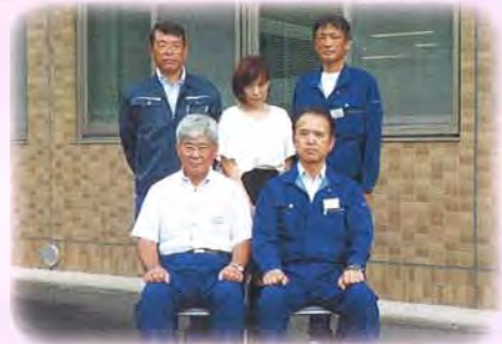
(私たちが施設を管理しています)

夜間、休日は、当番職員の携帯電話に転送されますので、転送アナウンスが流れるまでお待ちください。