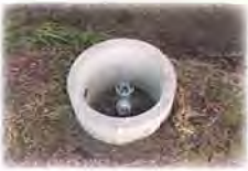
○給水栓設置 費用は無料です。