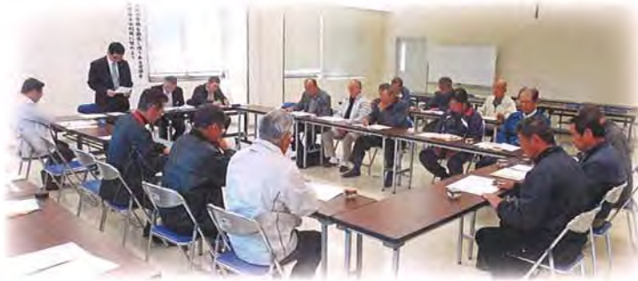
新役員体制で開催した理事会の様子