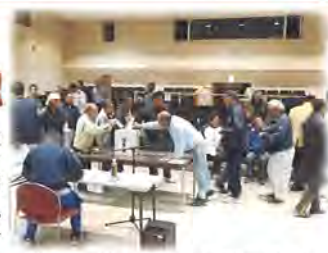
（写真は総代による投票の様子）

任期満了に伴う役員選任議案が第13回総代会において提出され、21名の役員が承認されました。