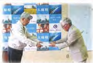
（写真は総代に代わり当選証書を受け取る事務局長）

任期満了に伴う総代選挙が大崎町選挙管理委員会の管理の下おこなわれ、65名の総代が無投票当選となりました。