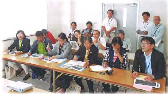
(ミャンマー農業畜産かんがい省のみなさま)

輝北ダムで畑かんがいによる基盤整備や水利用による生産性の高い畑作営農の普及について研修されました。