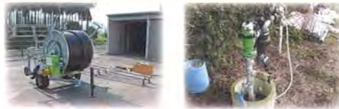
○散水器具導入 費用の約20%負担で導入できます。

野方方面は 来年で事業終了！ 補助事業が終了すると 給水栓設置 散水器具導入とも 100% 自己負担となります