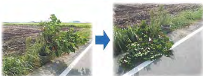
(給水マスの中で育った雑木)