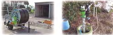
○散水器具導入 費用の約20%負担で導入できます。

野方方面は まもなく事業終了！ 補助事業が終了すると 給水栓設置 散水器具導入とも 100% 自己負担となります