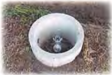
○給水栓設置 費用は無料です。