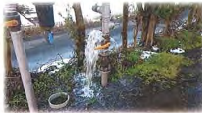
ボールバルブ破損