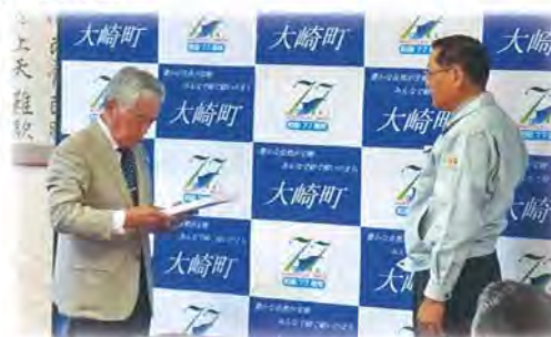
総代を代表して当選証書を受け取る事務局長