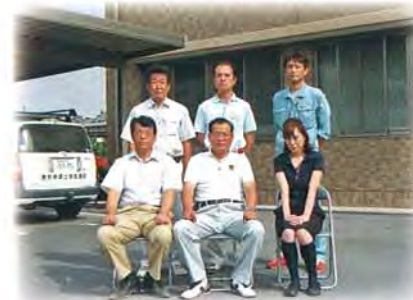
私たちが施設を管理しています