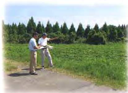
地区内の作付け調査