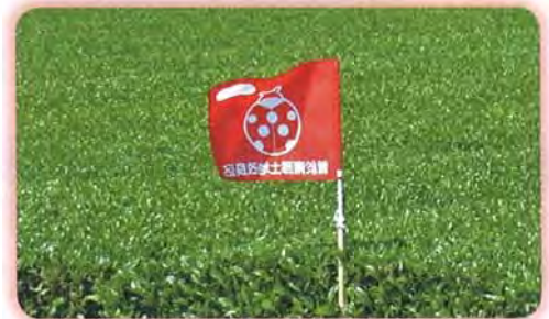
クワシロカイガラムシ防除の表示旗

散水量に制限がありますのでクワシロカイガラムシ防除については、毎年のお申し込みが必要です。