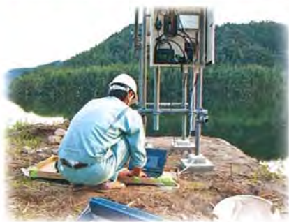
ダム周辺にカメラ監視装置を設置