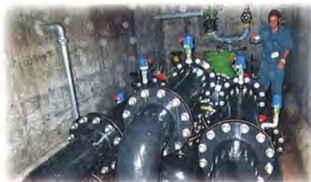
減圧弁の点検状況