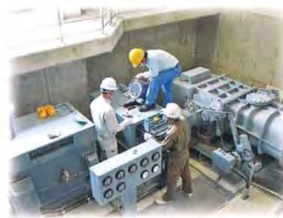
発電所のオイル交換