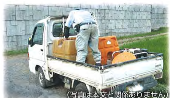
(写真は本文と関係ありません)

畑かん用水をタンクに貯めて、水利用のない、ほかの畑に散水することは認められません。