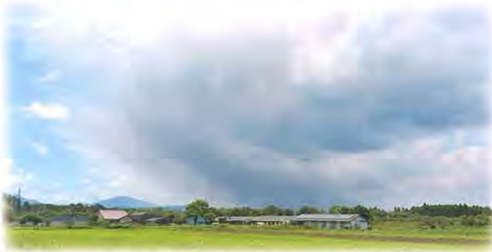
受益地に迫る桜島の火山灰