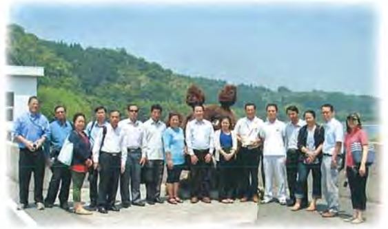
ラオス国 JICA-ASEAN 連携ラオスパイロットプロジェクトにおいて、ラオス国より 11 名が輝北ダムと畑かん施設研修に訪れました。

見学希望の方は、事前に曾於南部土地改良区へご連絡申込下さい。 曾於南部土地改良区 TEL: 099-471-0171