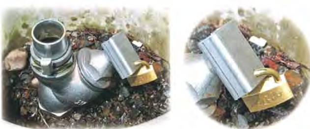
止水金具と南京錠

賦課金の納付や給水の手続きがないまま水を利用されている方の畑については給水栓に止水金具を取り付けます。