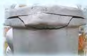
凍結による器具破損