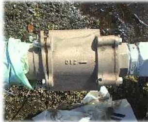
圧力調整弁の破損