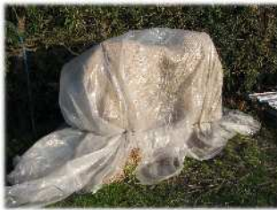
ハウス給水施設の保温例