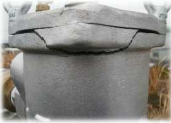
フィルターの破損