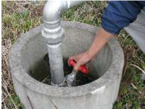
給水栓を閉めます