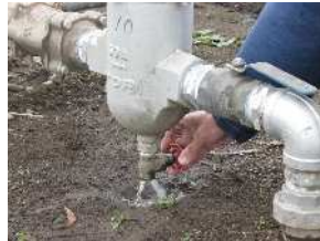
フィルターや取水バルブから水を抜きます