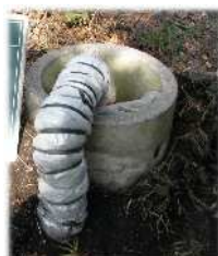
配管露出部分の保温例