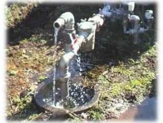
給水栓の破損による 漏水発生