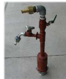
簡易散水器具は 取り外して保管しましょう