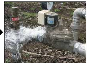
勢いよく水を放出します