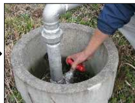
水が止まったら元栓を全開にします