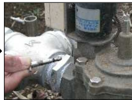
手動コックを取り外します