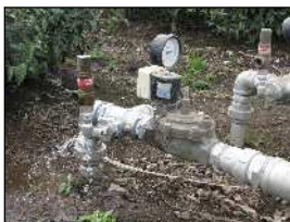
元栓を少し閉めて水の勢いを弱めます