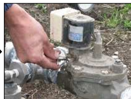
水を出したまま手動コックを戻します