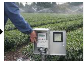
正常に作動するか確認します